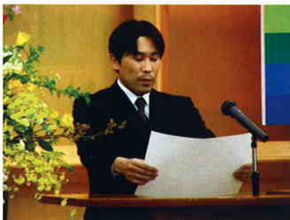
行動指針を披露する西郷支所 藤岡