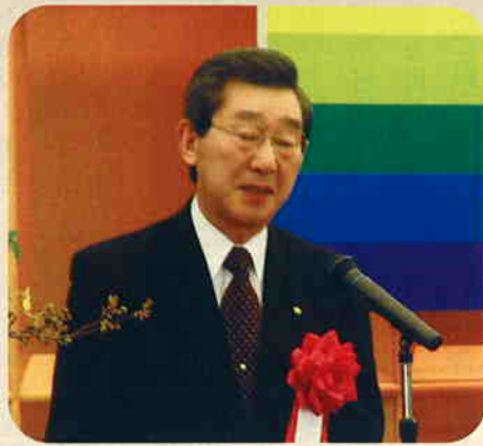
代読される松尾秀孝島根県副知事