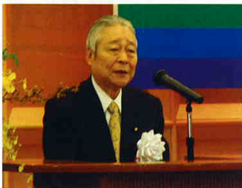
祝辞を述べられる青木参議院自由民主党議員会長