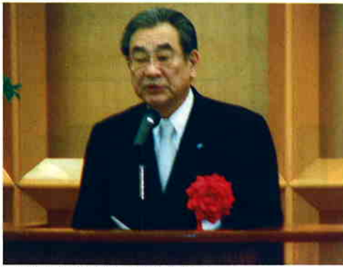
挨拶をする岸JFしまね会長