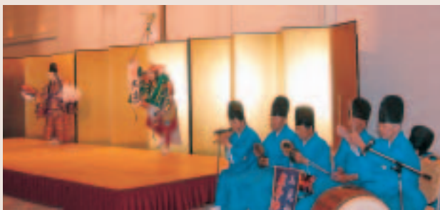
佐野神楽社中による「恵比須」