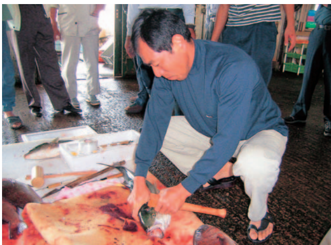
延髓締めに挑戦する参加者

出雲市大社町沖は、全国でも有数のブリの漁場。現在、大社地区の組合員等が中心となり、釣り（主に曳き縄釣り）で漁獲するブリについて「大社ブリ」としてブランド化に取り組んでいる。