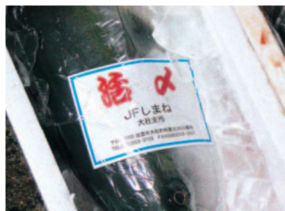
活処理済みの専用ステッカー

当時の大社のブリは、市場での鮮度に対する評価が低く、また、3月から5月にかけて水揚げが最盛期となり、需要期から外れるなどの要因から魚価が低迷したこともあった。しかし、近年、水氷処理でも鮮度が保たれていることが実証され、さらに鮮度保持の効果を高めるために、活締め処理を取り入れることで、活きの良いブリとしてPRを図り、魚価の向上を狙っている。