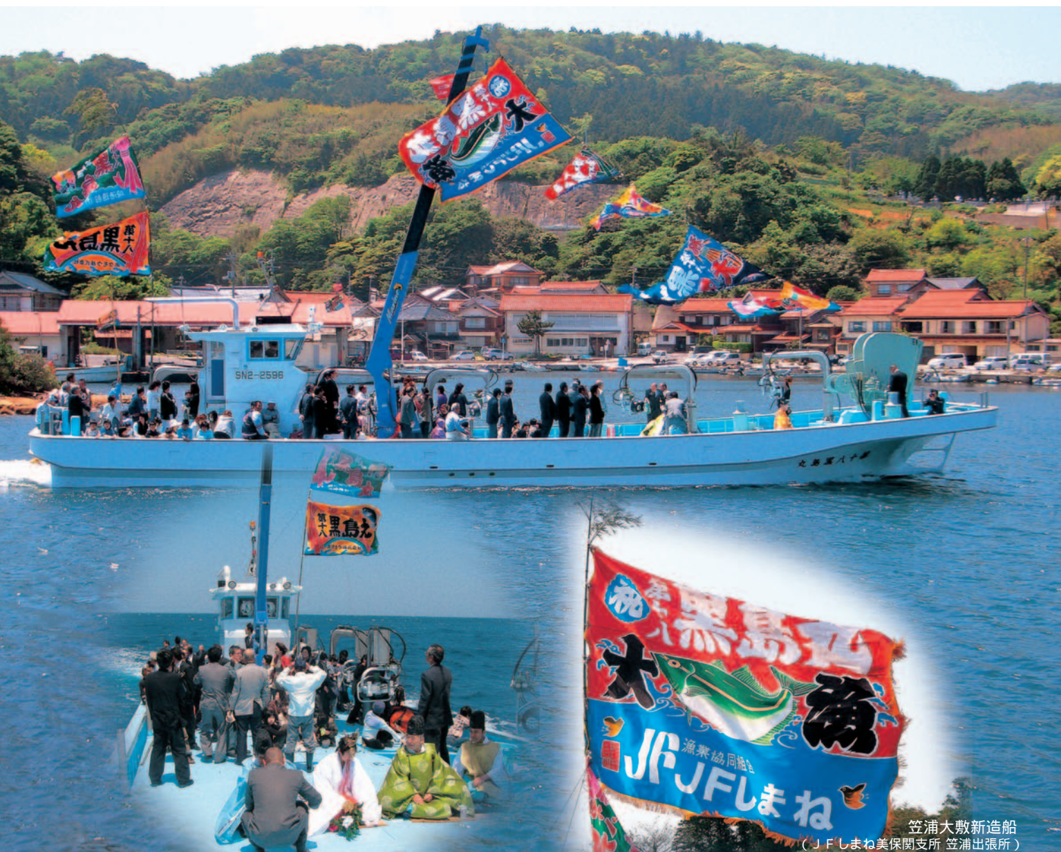
笠浦大敷新造船 (JFしまね美保開支所 笠浦出張所)