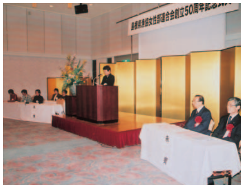
式辞を述べる青山県漁協女性連合会長

役割も多様化し、県行政の諮問機関への参画など、多方面にわたる積極的な活動を行っている。