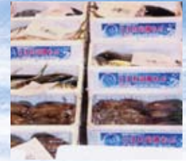
箱に認証シールを貼って、市場等に出荷します。