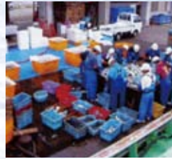
帰港後、すぐに魚の仕分け作業をし、冷却します。