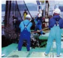
獲れた魚はすぐに殺菌冷海水の船倉に入れます。