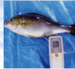
魚の体温を測ります。概ね5℃以下に保ちます。