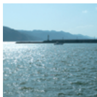
穏やかな時もあれば、激しい時もある。それもまた海の魅力だ。

港に帰って、捕れた魚を荷揚げします。大漁のときは大変だけど、嬉しさが先に来るので、疲れなんか感じませんよ！