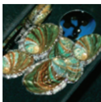
出荷できるまでには約3年間を要す。まだまだ掛かりそう。